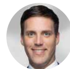
Manuel Hagel CDU