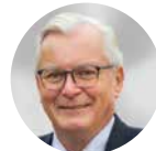
Bernd Gögel AfD