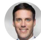
Manuel Hagel CDU