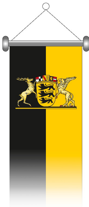
Muster II. 5 (Banner):