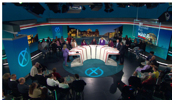
Die sieben Spitzenpolitiker aus RLP in der Wahlarena zusammen mit den Moderatoren Daniela Schick und Sascha Becker