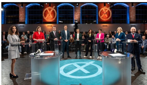
Die sieben Spitzenpolitiker aus BW in der Wahlarena zusammen mit den Moderatoren Florian Weber und Steffi Haiber

likum. Das Zuschauerinteresse war groß: In Baden-Württemberg schauten 245.000 Menschen (Marktanteile: 7,4 %) und in Rheinland-Pfalz 92.000 Menschen (Marktanteile: 7,1 %) die Sendung an. Bundesweit sahen die Baden-Württemberg-Sendung 297.000 Menschen, die Rheinland-Pfalz-Sendung 111.000 Menschen. Die SWR Wahlarenen wurden außerdem online für beide Bundesländer Baden-Württemberg und Rheinland-Pfalz auf SWR.de begleitet.