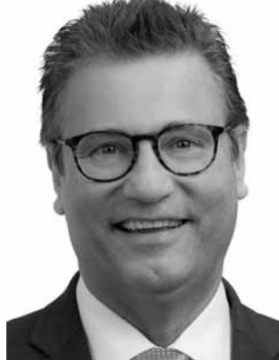
Hauk, Peter CDU Minister für Ernährung, Ländlichen Raum und Verbraucherschutz a. D. *1960 Wahlkreis 38 (Neckar-Odenwald)