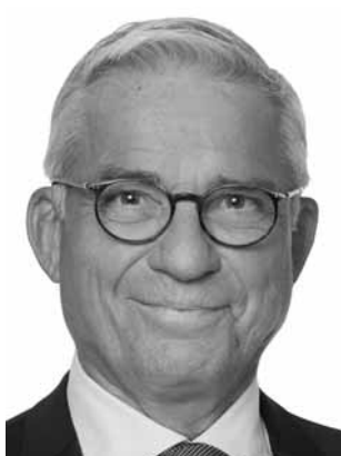
Strobl, Thomas CDU Landtagspräsident, Minister a. D., Rechtsanwalt *1960 Wahlkreis 18 (Heilbronn)