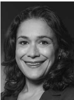
Saint-Cast, Nadyne BÜNDNIS 90/DIE GRÜNEN Politikwissenschaftlerin *1979 Wahlkreis 47 (Freiburg II)