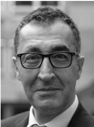
Özdemir, Cem BÜNDNIS 90/DIE GRÜNEN Ministerpräsident, Bundesminister a. D., Diplom-Sozialpädagoge (FH); *1965 Wahlkreis 2 (Stuttgart II)