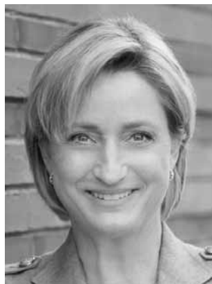
Dr. Hoffmeister-Kraut, Nicole CDU Ministerin für Wirtschaft, Handwerk und Tourismus; *1972 Wahlkreis 63 (Balingen)