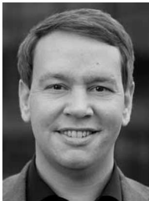
Hildenbrand, Oliver BÜNDNIS 90/DIE GRÜNEN Minister für Soziales, Arbeit und Gesundheit, Psychologe; *1988 Wahlkreis 3 (Stuttgart III)