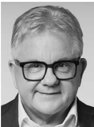
Wolf, Guido CDU Landrat a. D., Landtagspräsident a. D., Minister der Justiz und für Europa a. D. *1961 Wahlkreis 55 (Tuttlingen-Donaueschingen)